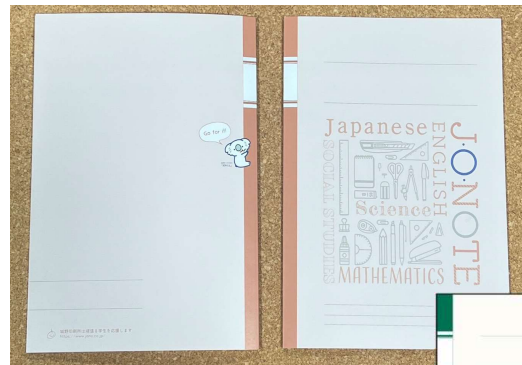
熊本県内に配布された第4回「J・O・NOTE」

熊本県に続き、今回、福岡県北九州市と宮崎県でも「J・O・NOTE」の配布を実施し、今後は九州全域、さらには全国へと支援の輪を広げていく予定です。